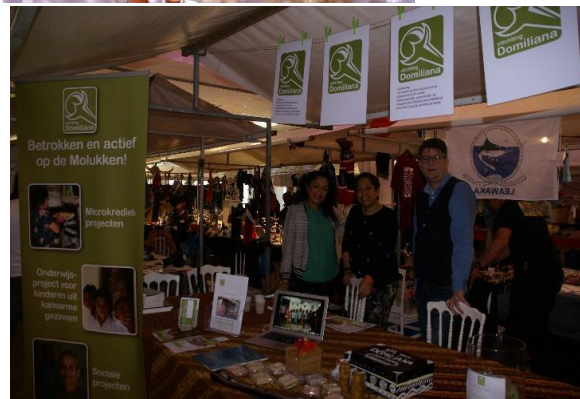
Pasar Malam Maluku Den Haag 2018